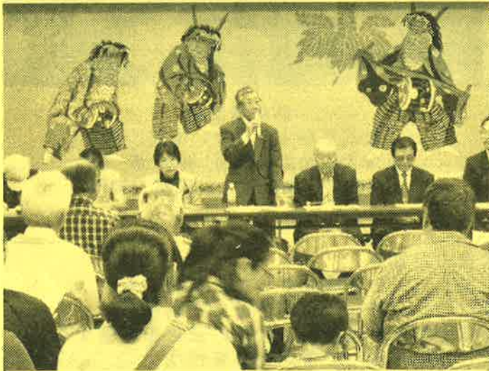
「令和元年度定期総会 会長あいさつ」 (R1.5.11 豊野地区公民館 講堂)

令和元年5月11日(土)、令和元年度の定期総会を豊野地区公民館講堂で開催しました。総会では、多くの皆さんにご出席いただき、平成30年度の事業報告、決算報告、監査報告を行うとともに、令和元年度の事業計画案、予算案を議案として提出し全てが承認されました。本年度も豊野地区全体の防災のため、皆様のご協力をよろしくお願いいたします。