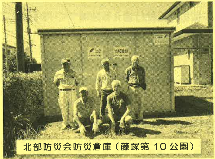
北部防災会防災倉庫（藤塚第10公園）